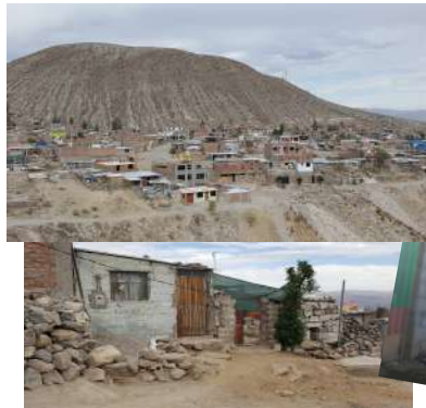
Las fotos nunca son suficientes para describir la realidad.

En nuestra visita del verano 2018 conocimos la situación de extrema pobreza en la que se encontraban algunas familias de la escuela y de COFARI. Nuestra ayuda les permite paliar alguna de sus principales necesidades.