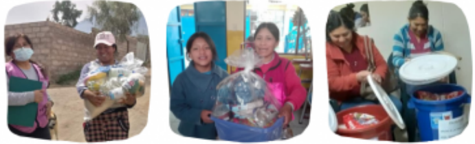
Plan de emergencia para ayuda a las familias